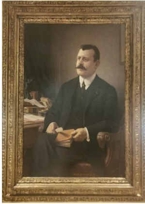
A Roanne, le 20 mai 2022, au Musée Joseph Dechelette