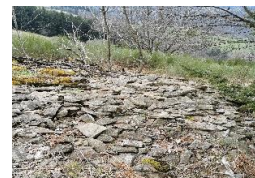
Epierrément ou tombe près d'une voie antique ? - Rochetaillée