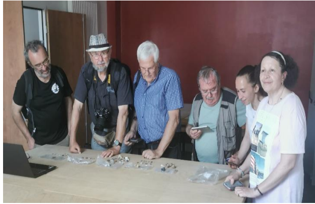
... puis au « Dépôt de fouilles » : les silex mésolithiques de la Font-Ria