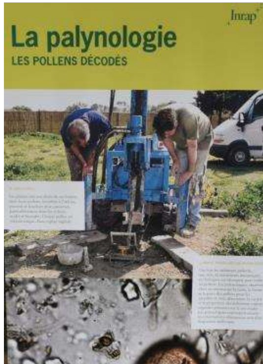
Expo musée St Laurent Grenoble